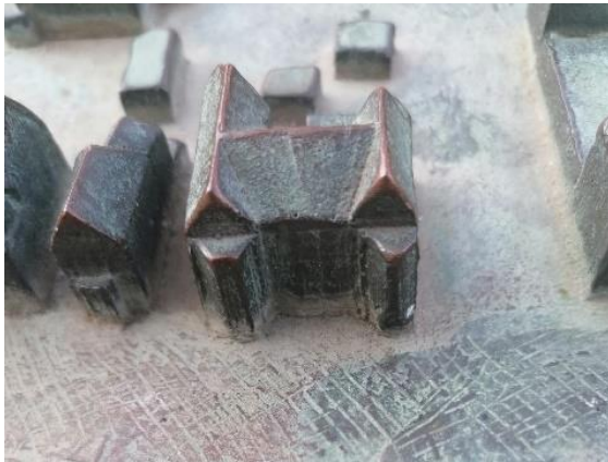
Foto von Susann , aufgenommen auf dem Marktplatz in Heide: „Am südlichen Ende steht ein Stadtmodell. Es besteht aus Bronze und kann nicht nur bestaunt, sondern auch ertastet werden. Auf diesem Foto sehen Sie das aus Bronze gefertigte Gebäude der Brücke Dithmarschen.“

Man mag es kaum glauben - auf 40 erfolgreiche Jahre kann die Brücke Dithmarschen mittlerweile zurückblicken. Gegründet wurde sie im Jahr 1986 – zu einer Zeit, als es noch nicht einmal die psychiatrischen Stationen im WKK gab. Damals erkannte man die Notwendigkeit der ambulanten psychiatrischen Betreuung vor Ort. Denn die nächsten Fachkliniken waren weit.