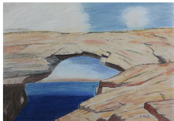
„Die steinerne Brücke“ (Pastellkreiden), Silke Weißel