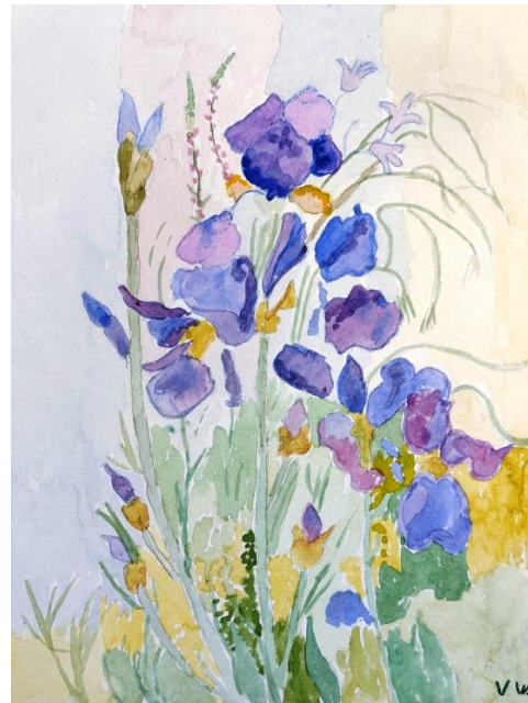
„Blaubeerenrausch“ (Aquarell), Vera Warnke