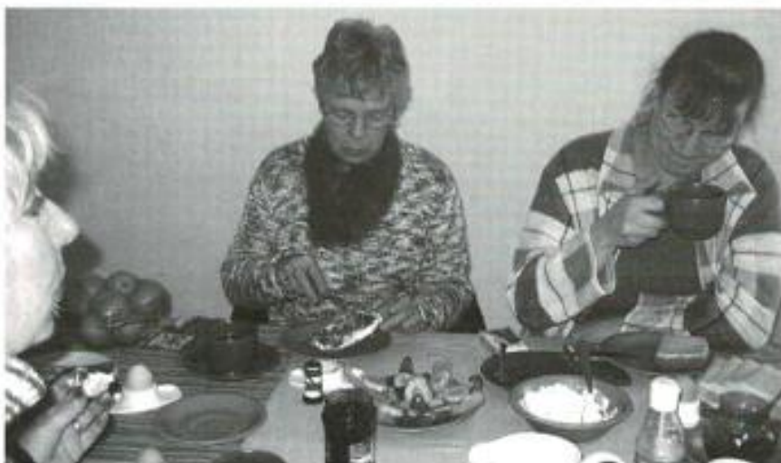
Urlaub vom Alltag im Café Olé

gemeinsam. Durch unsere Diskussionen erhalte ich oft eine andere Sichtweise der Dinge. Das ist hilfreich, weil sich eingefahrene Situationen auflösen und sich neue Perspektiven ergeben. Ich lerne zuzuhören und Geduld mit anderen und mir selbst zu haben. Ich freue mich jedes Mal auf unsere