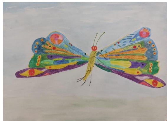
„Schmetterling“ (Aquarell), Sabine Boldt

Lehrer: „Fritzchen , was ist das für ein Schmetterling?“ Fritzchen: „Ein Zitronenfalter, Herr Lehrer.“ Lehrer: „Aber Fritzchen, der hier ist grün und nicht gelb.“ „Vielleicht ist er noch nicht reif, Herr Lehrer?“